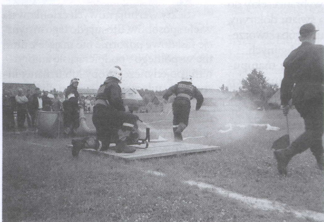
Strażacy w „akcji”...

Po rozegranych konkurencjach wyniki przedstawiały się następująco: