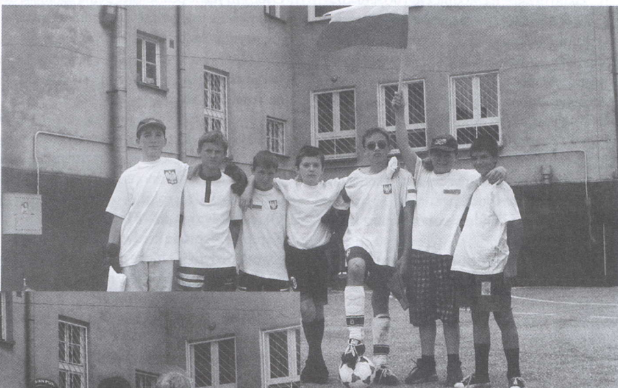
Młodzi piłkarze z Borzęcina Dolnego.