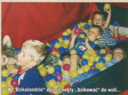
W „Bzikolandzie” dzieci mogły „bzikować” do woli...