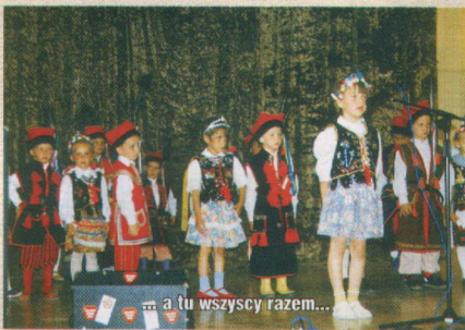
... a tu wszyscy razem...