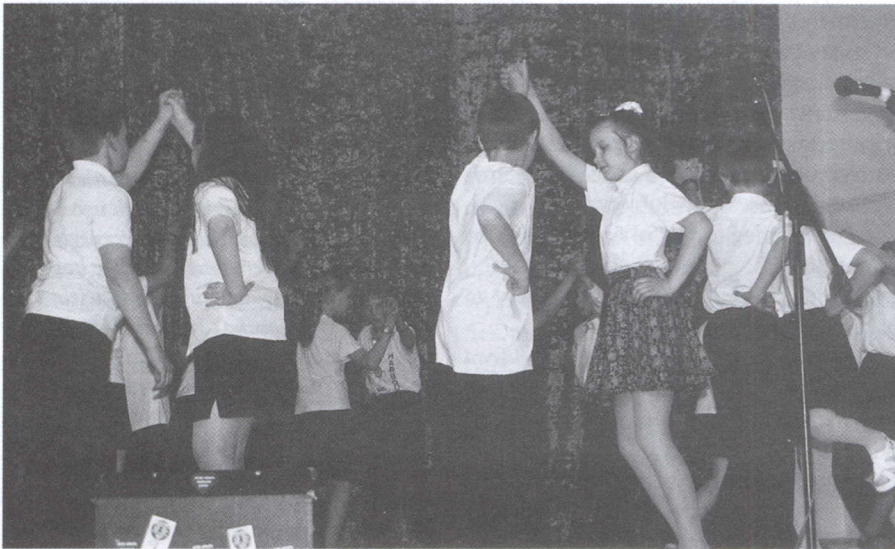
Dzieci z Borzęcina miały co pokazywać swoim mamom.