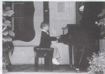
Młodzi artyści - na „życzenie” - grali utwory F. Chopina podczas przerwy w konkursie fortepianowym uczniów i absolwentów tarnowskiego Liceum Muzycznego.