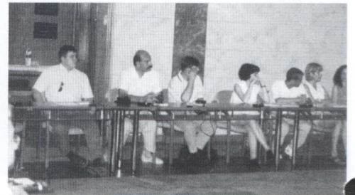
Z wizytą u wojewody w Veszpremie

zakresie przez regionalny związek gmin, która technologicznie odpowiada wymogom i standardom XXI wieku. Na przykładzie nowo oddanych do użytku szkół w Sarosd i Seregelyes urzędnicy mnie staranność samorządów węgierskich w kwestii tworzenia młodzieży szkolnej idealnych warunków nauczania. Sądzę, iż była to bardzo cenna wizyta, tym bardziej iż w ramach rewizyty strony węgierskiej dojdzie do konkretyzacji wypracowanych na Węgrzech stanowisk.