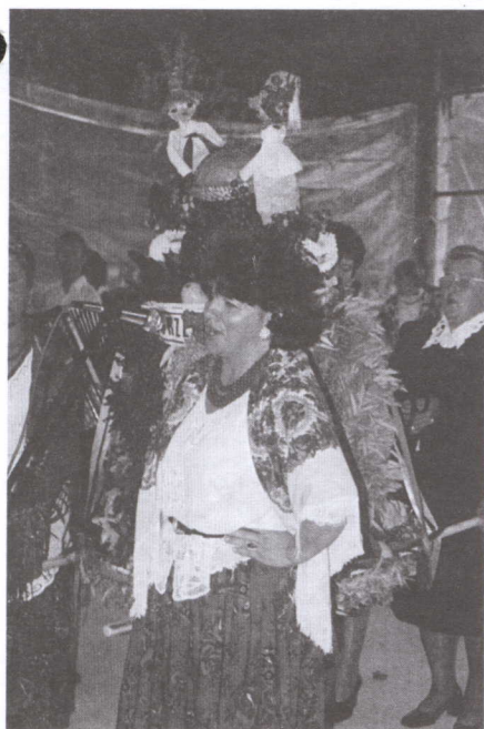
Oceniano także śpiew....