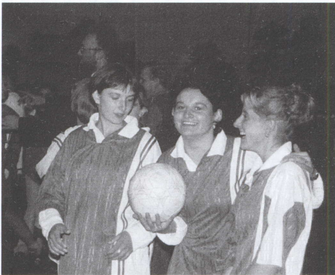
W meczu brały także udział osoby z naszej gminy.