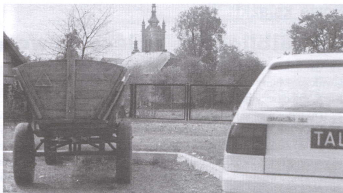
„Poznaj swój wóz”.