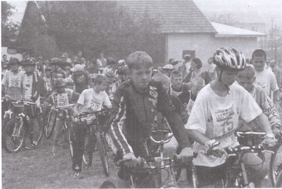
Bielczańskie zawody zgromadziły wielu kolarzy.