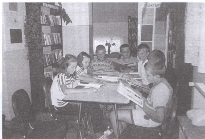
Konkurs w Bielczy trwa...